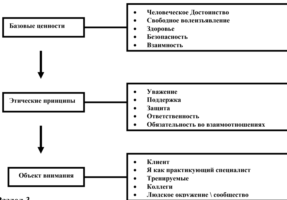
Рис. 1 Синтез основ этического кодекса: три уровня анализа деятельности с точки зрения этики.