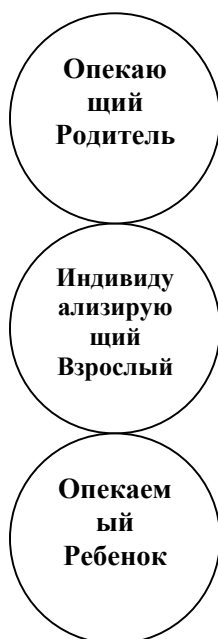
Рис 1. Функциональная модель первого порядка

В основном они выполняют функции адаптации и необходимы, прежде всего, для выживания, но также необходимы и для жизни. Каждое из трех эго-состояний проявляет свои собственные функции. Это очень просто: людям жизненно необходимо, чтобы о них заботились, уметь заботиться о других и отличаться от других. Таким образом, филогенетическая эволюция сформировала такие базовые функции как: у Опекаемого Ребенка – искать и получать заботу; у Опекающего Родителя – заботиться о других и у Индивидуализирующего Взрослого – делать людей отличными от других. (Если смотреть шире, я считаю, что проявление заботы подразумевает не только здоровое кормление и защиту, но также все модели поведения, послания, уроки и даже объекты, которые положительно влияют на здоровое развитие человека [Oller-Vallejo, 2001b]).