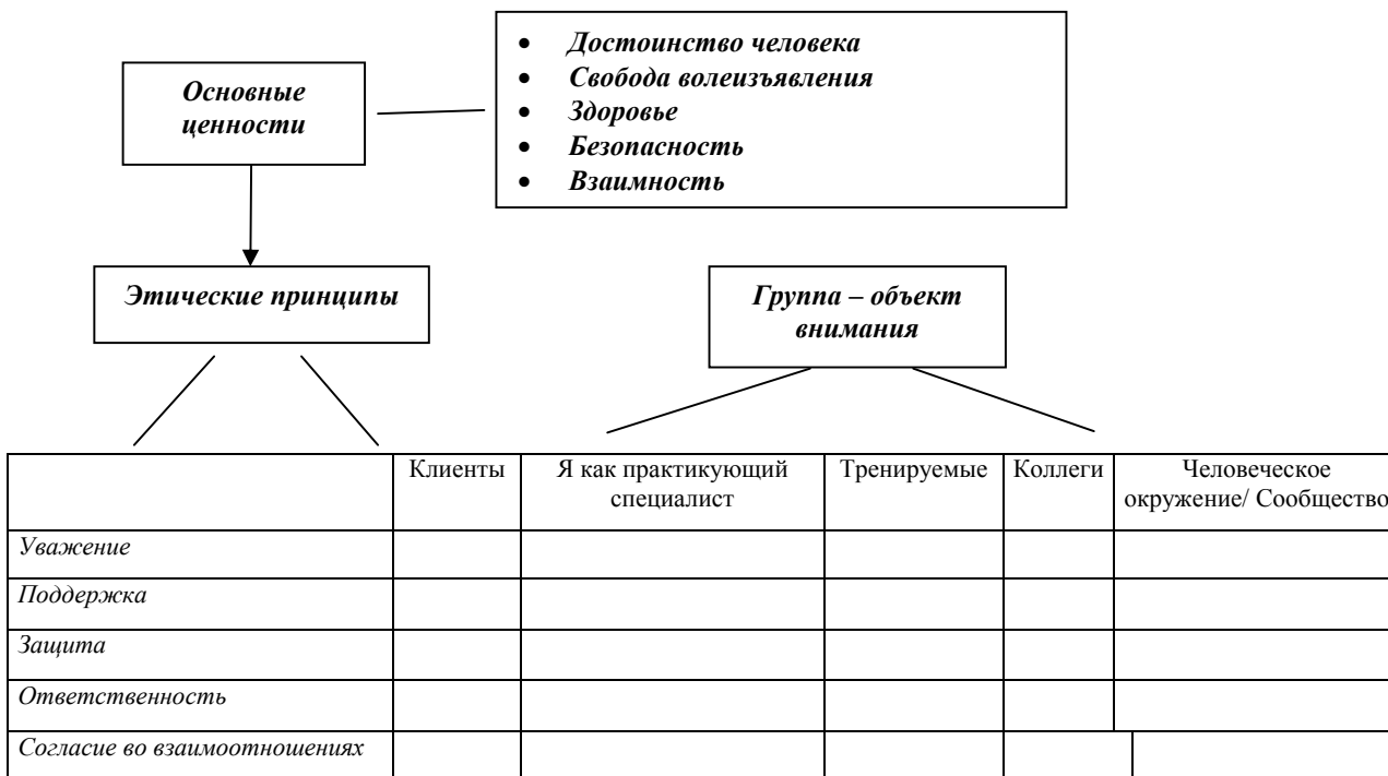
Рис.2 Руководство для этической оценки

Содержание следующей схемы (рис. 2) то же, что и содержание предыдущей. Таким образом, показывается, что «основные ценности» являются фундаментальным условием анализа каждой ситуации с точки зрения Этики. Также подчеркивается важность оценки ситуации с точки зрения каждого этического принципа и в соответствии с отдельно взятой целевой группой, что позволяет сделать обдуманый вывод.